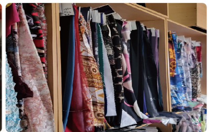
( 원단 )