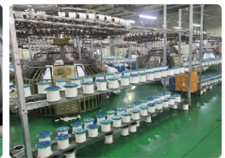
( 편직 )