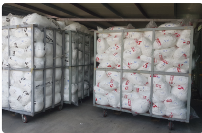
( 생지 )