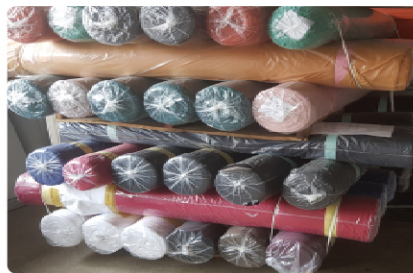
( 가공지 )