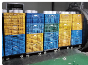
( 셋팅 )