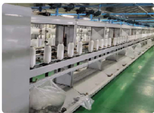
( 합사 )