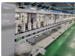
( Сүлжмэл утас )