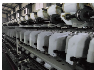
( Мөлтифиламент )