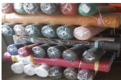
( Бэлэн бүтээгдэхүүн )