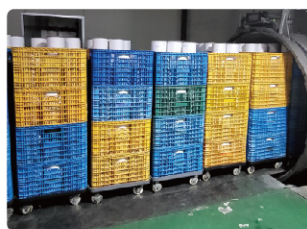
( Тохиргоо )