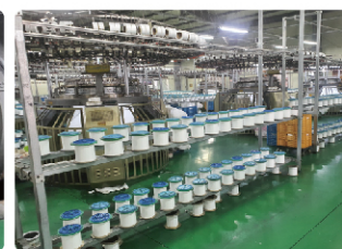
( Сүлжих )